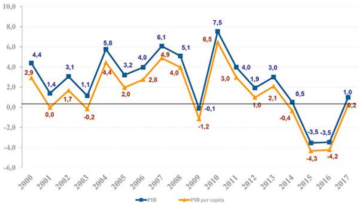
PIB e PIB per capita Taxa (%) de crescimento anual