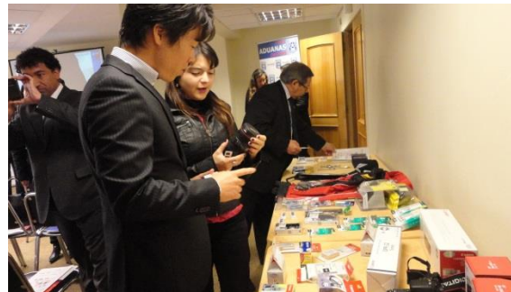
真贋判定セミナーの様子