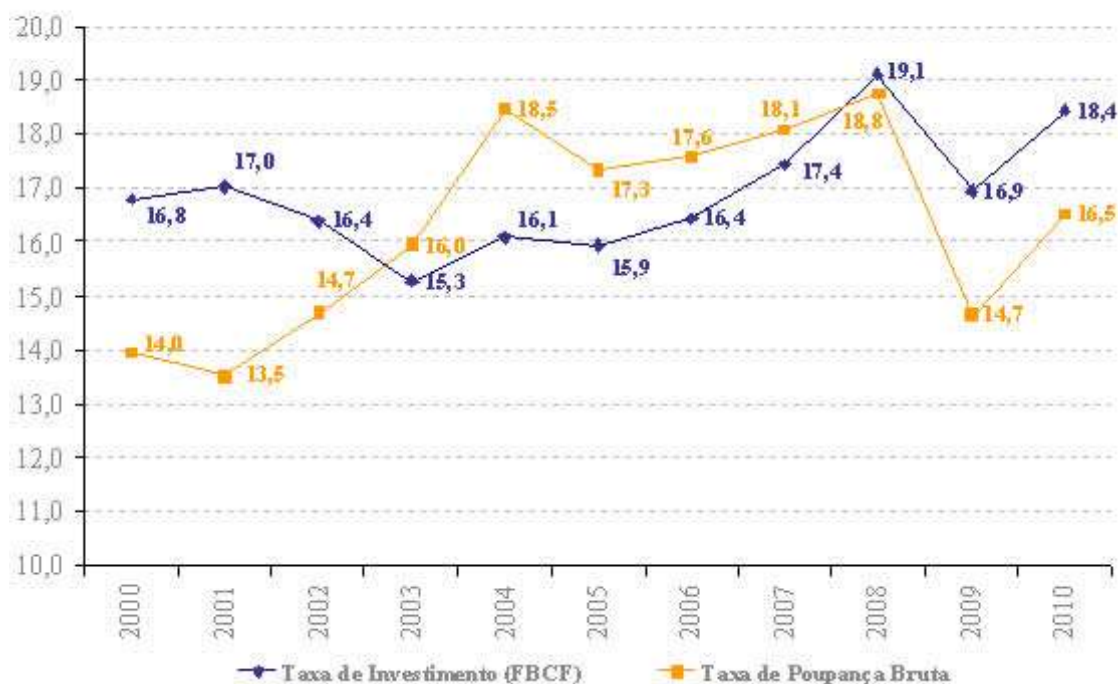
GRÁFICO III.1 - Taxa de Investimento e Taxa de Poupança Bruta (% do PIB)