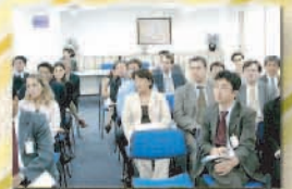
Seminário Mensal da Comissão Jurídica (fevereiro de 2006).