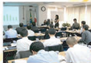
Seminário em inglês, realização conjunta dos depts. de Comércio Exterior e de Consultoria e Assessoria (novembro de 2005).