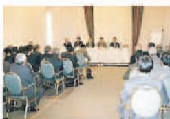
Simpósio dos presidentes dos Departamentos, do segundo semestre de 2005.