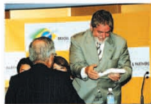
Entrega da enciclopédia "Brasil Contemporâneo" pelo presidente da Câmara, Makoto Tanaka ao presidente da República Lula, durante visita ao Japão (maio de 2005).