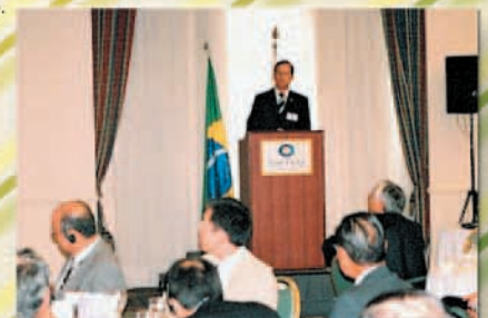
Ministro do Desenvolvimento, Luiz Furlan, em palestra durante o Almoço de Confraternização (fevereiro de 2006).