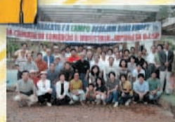
Visita de Estudos à região dos Cerrados, realização conjunta com a Câmara de Comércio e Indústria Japonesa do Rio de Janeiro (março de 2003).